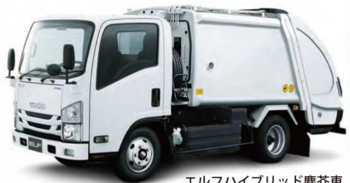
エルフハイブリッド塵芥車